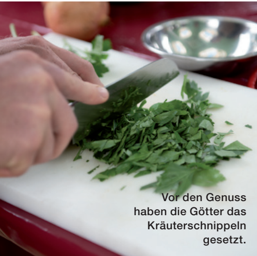
Vor den Genuss haben die Götter das Kräuterschnippeln gesetzt.