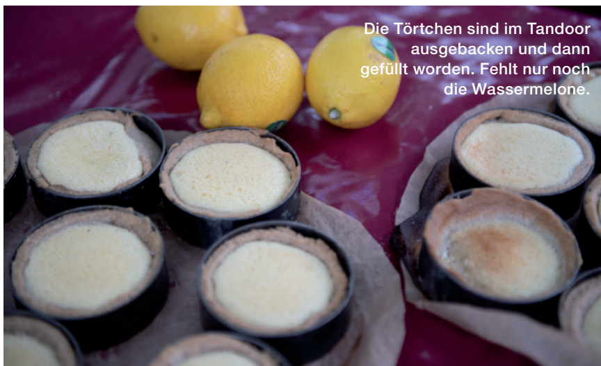
Die Törtchen sind im Tandoor ausgebacken und dann gefüllt worden. Fehlt nur noch die Wassermelone.