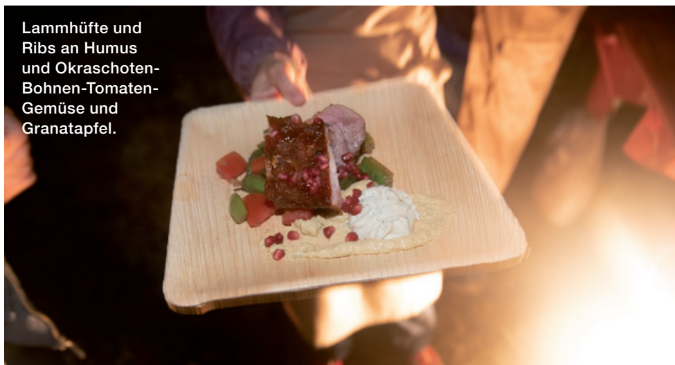
Lammhüfte und Ribs an Humus und Okraschoten-Bohnen-Tomaten-Gemüse und Granatapfel.