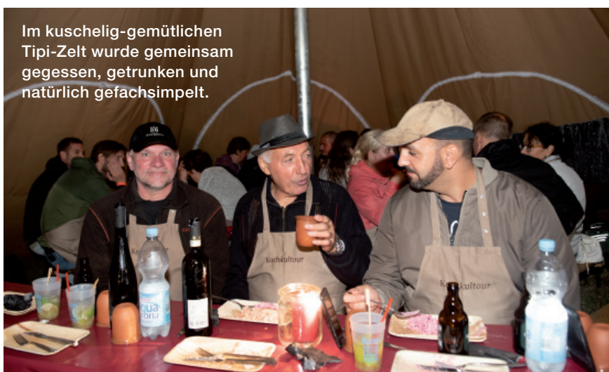
Im kuschelig-gemütlichen Tipi-Zelt wurde gemeinsam gegessen, getrunken und natürlich gefachsimpelt.