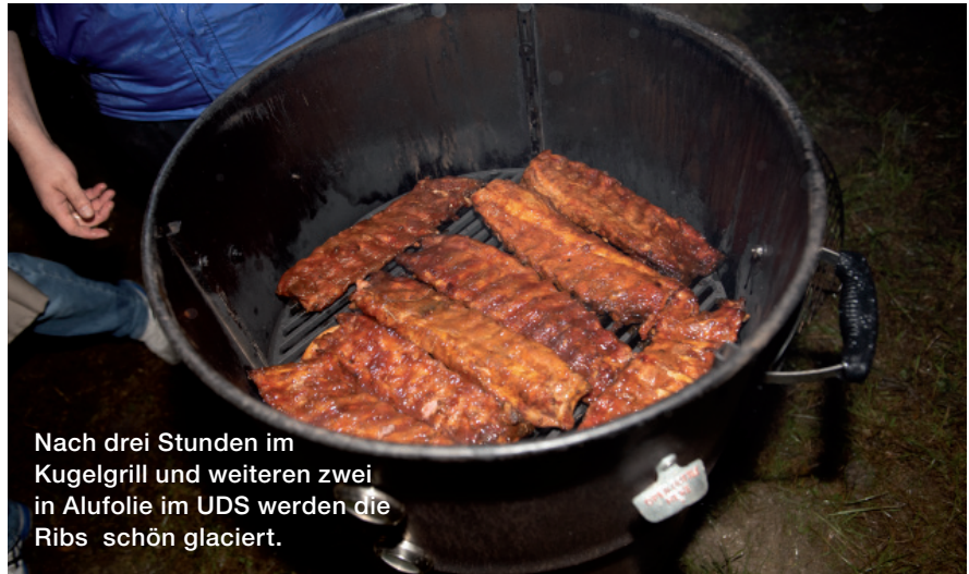
Nach drei Stunden im Kugelgrill und weiteren zwei in Alufolie im UDS werden die Ribs schön glaciert.

verrutschen können. Dann werden sie hochkant mit leichter Schräglage über der Glut aufgestellt, fixiert und über dem heißen Rauch langsam gegart.